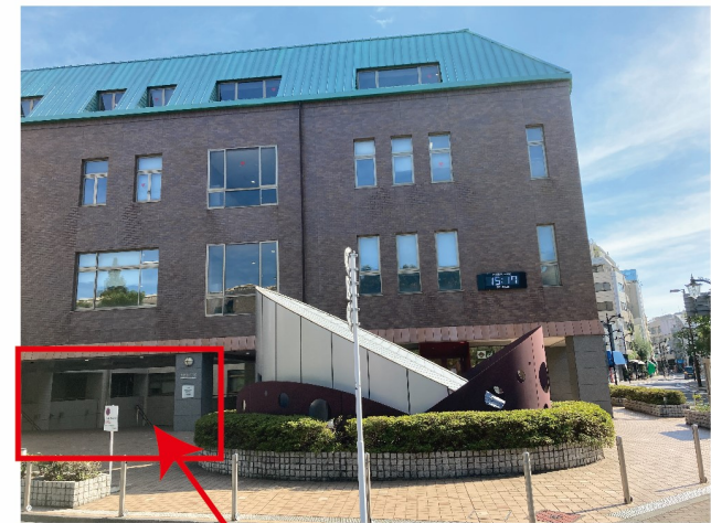
小野記念講堂外観